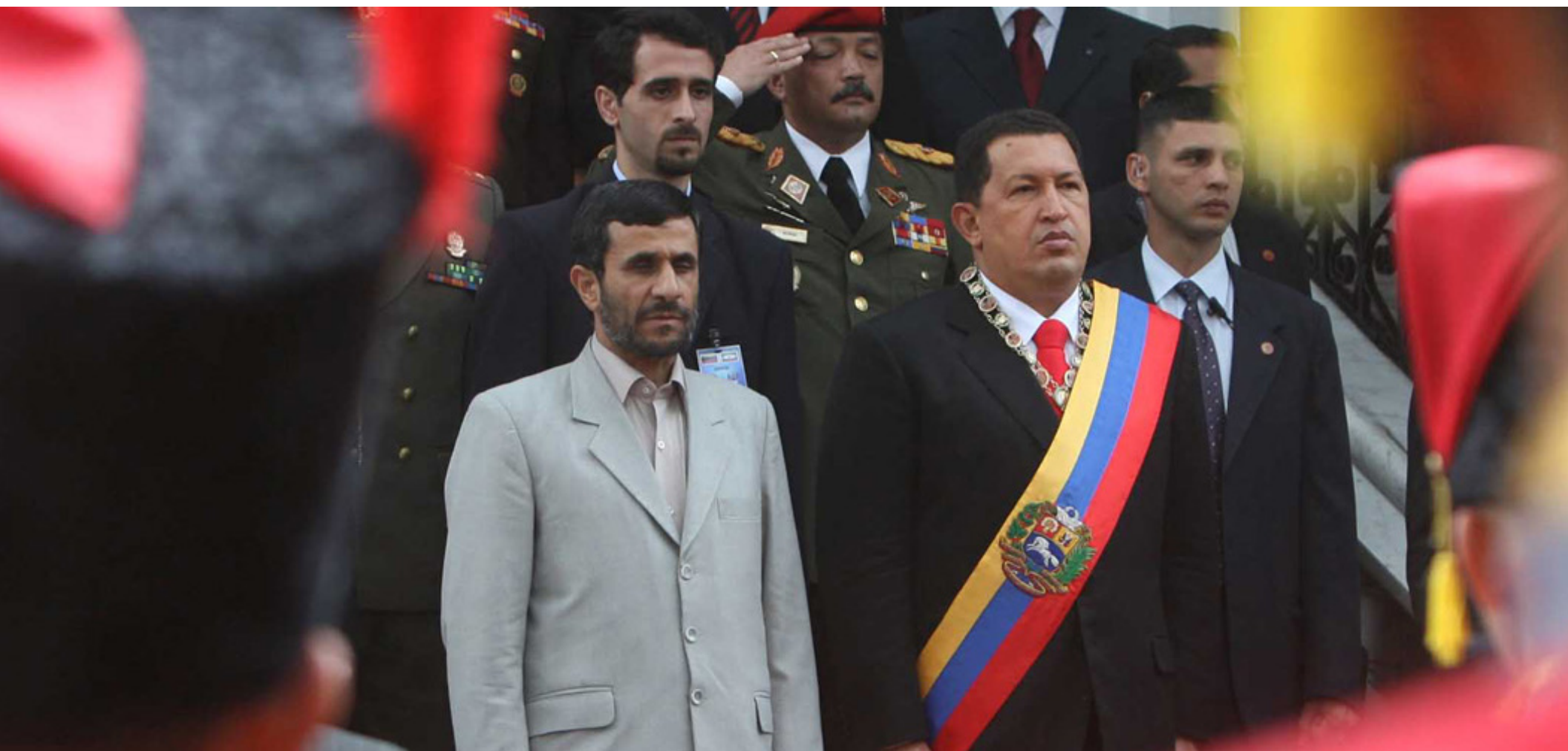
Presidente Chávez recibe en Palacio de Miraflores a su homólogo iraní Mahmud Ahmadinejad