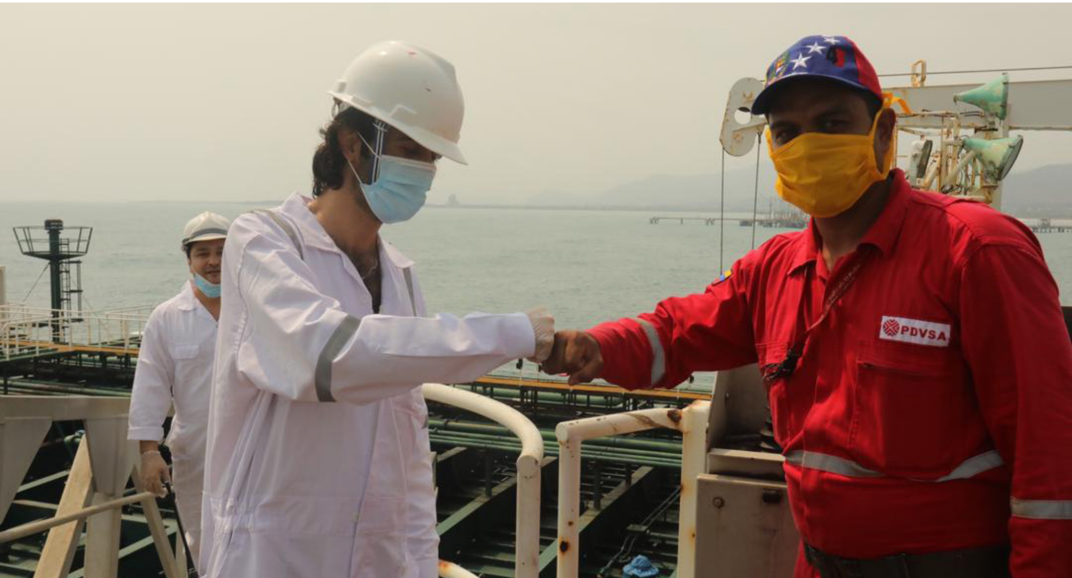
Trabajadores de Pdvsa reciben a tripulación de buques iraníes