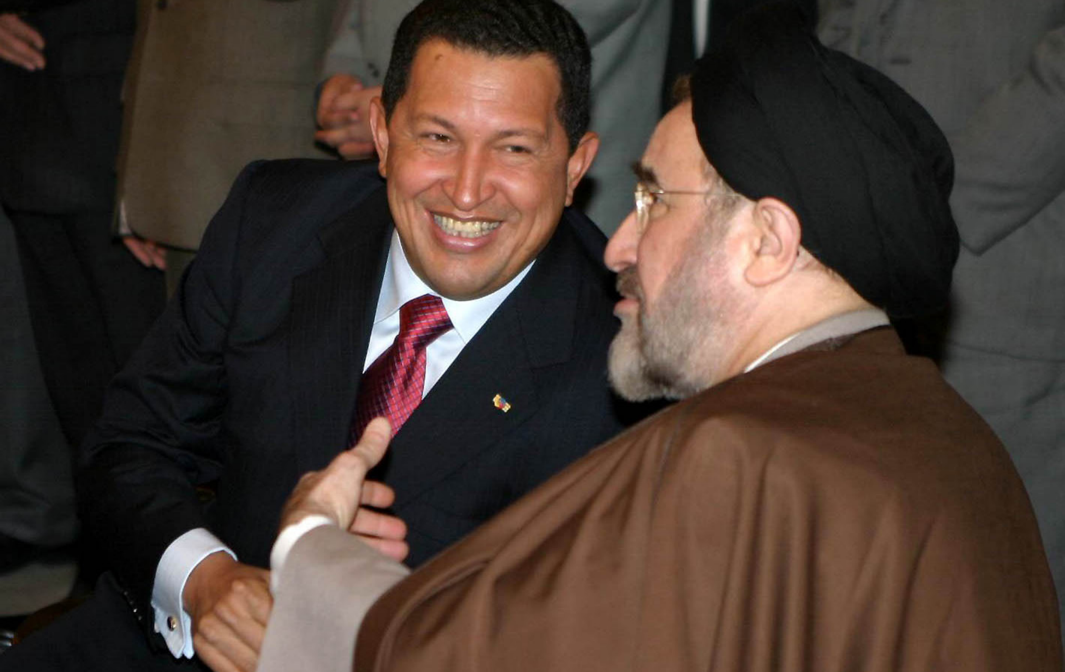
Presidente Hugo Chávez con su homólogo iraní Mohammad Khatami