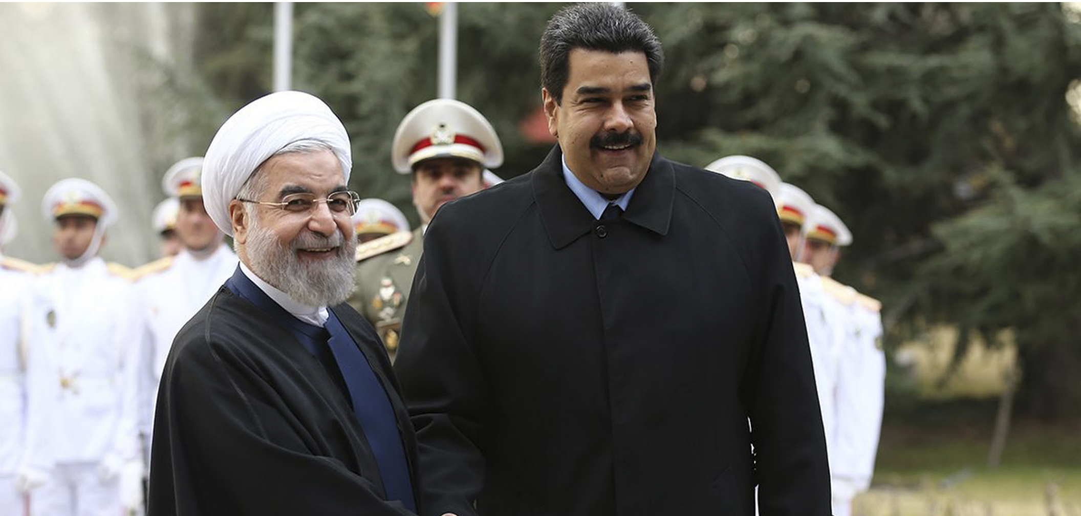
Presidente Nicolás Maduro Moros con su homólogo Hassan Rohaní