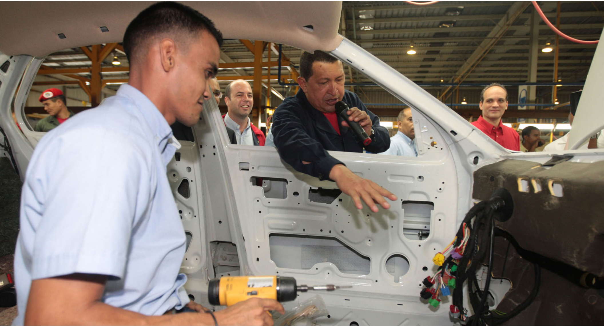
Presidente Hugo Chávez en fábrica ensambladora de vehículos iraníes