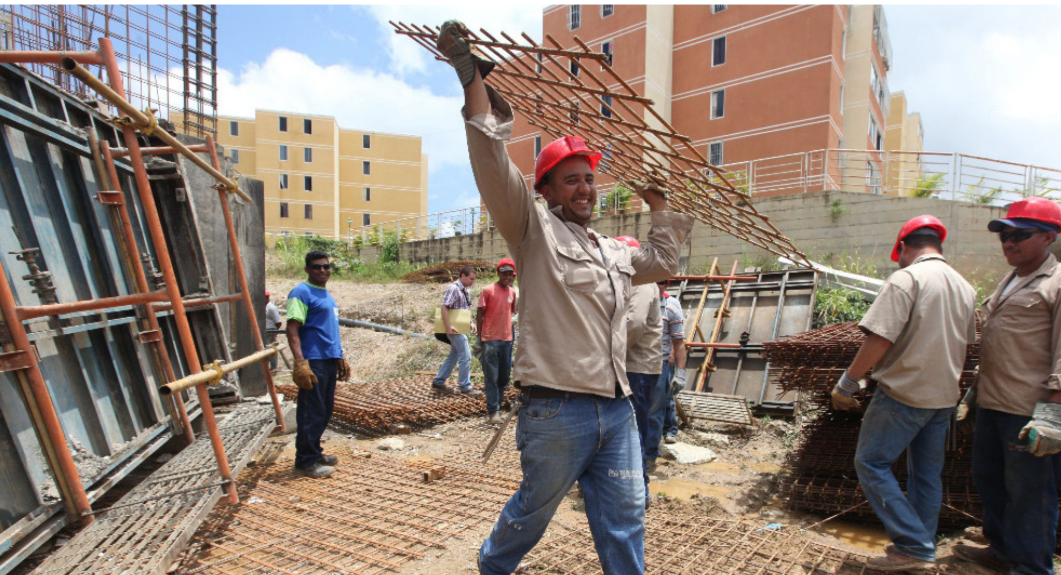
Construcción de Urbanismos