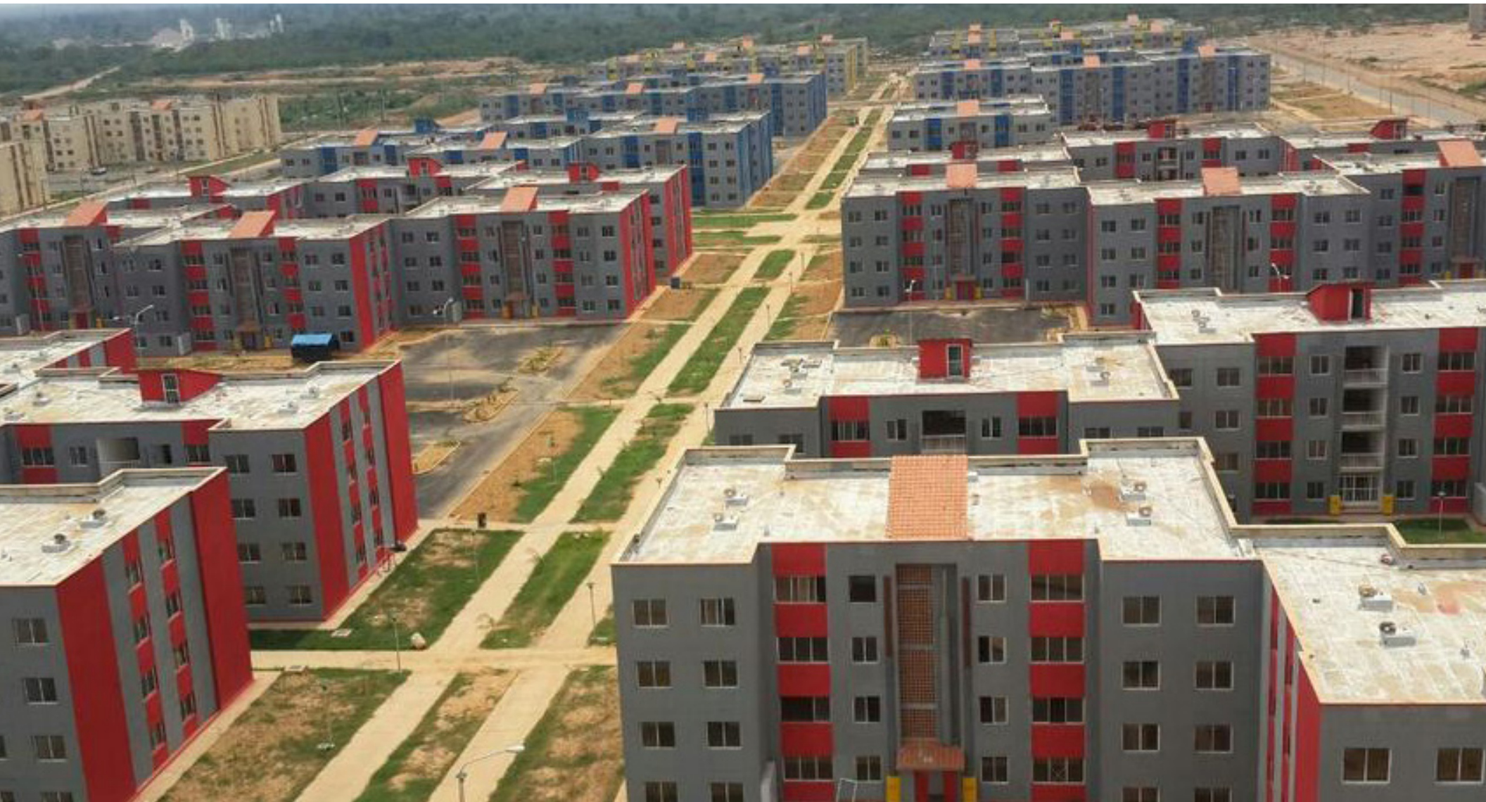
Viviendas Convenio Venezuela-Irán