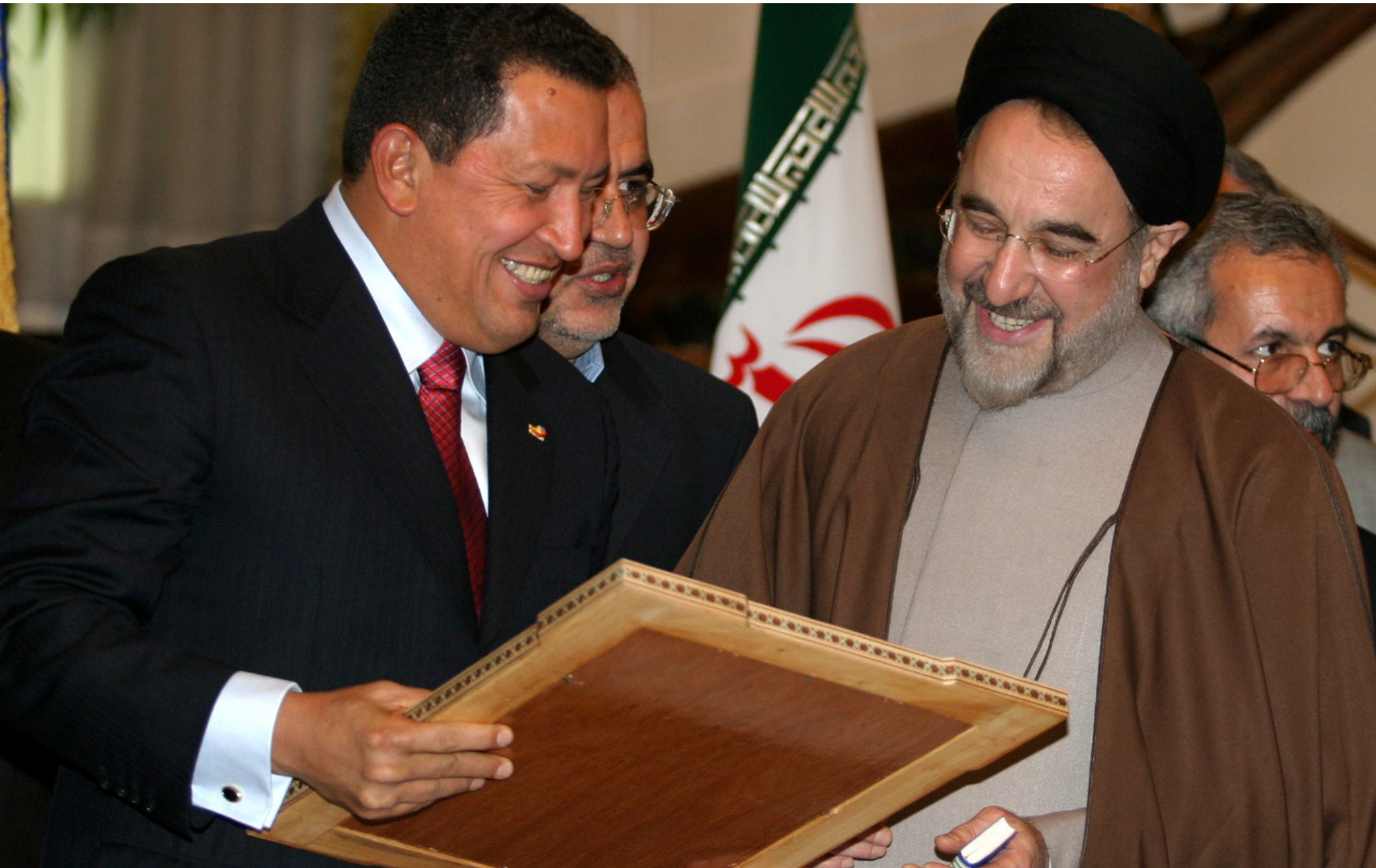
Presidente Hugo Chávez recibe un obsequio del presidente Mohammad Khatami