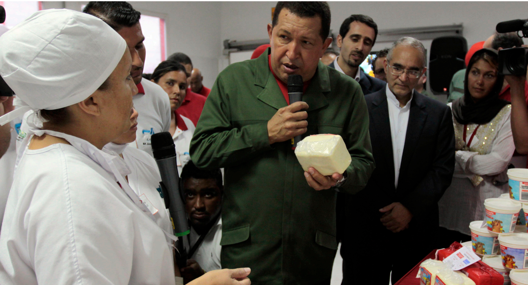
Presidente Hugo Chávez en Plantea Láctea