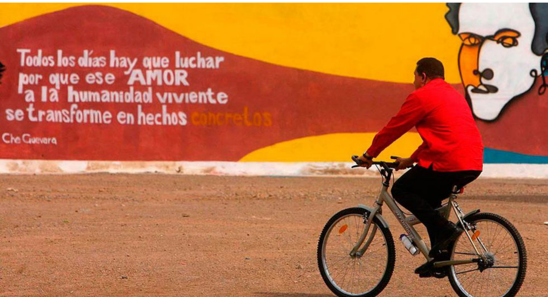
El presidente Hugo Chávez monta bicicleta de fabricación iraní