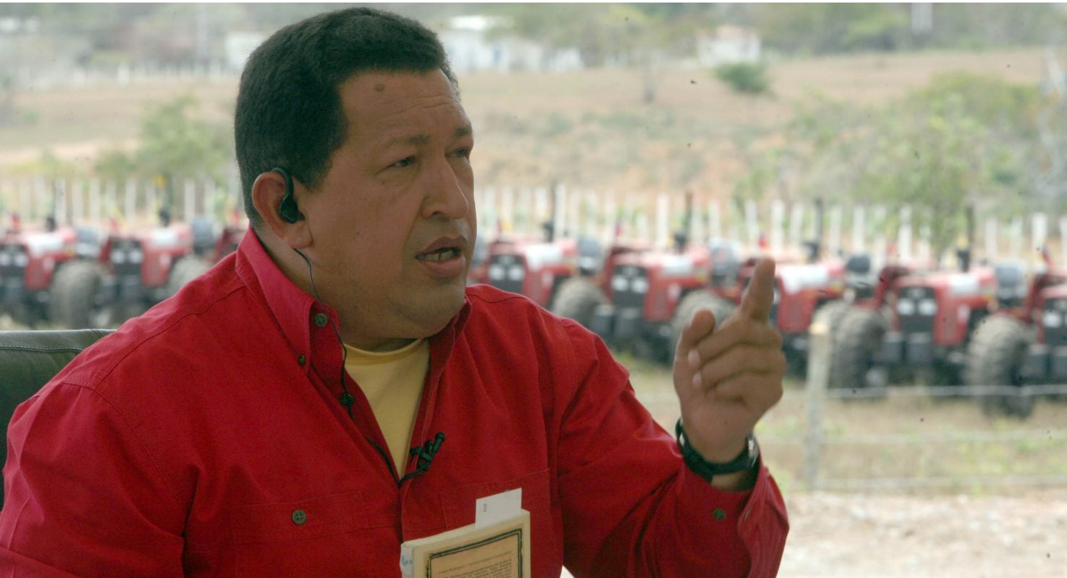
Entrega de tractores iraníes por parte del Presidente Hugo Chávez