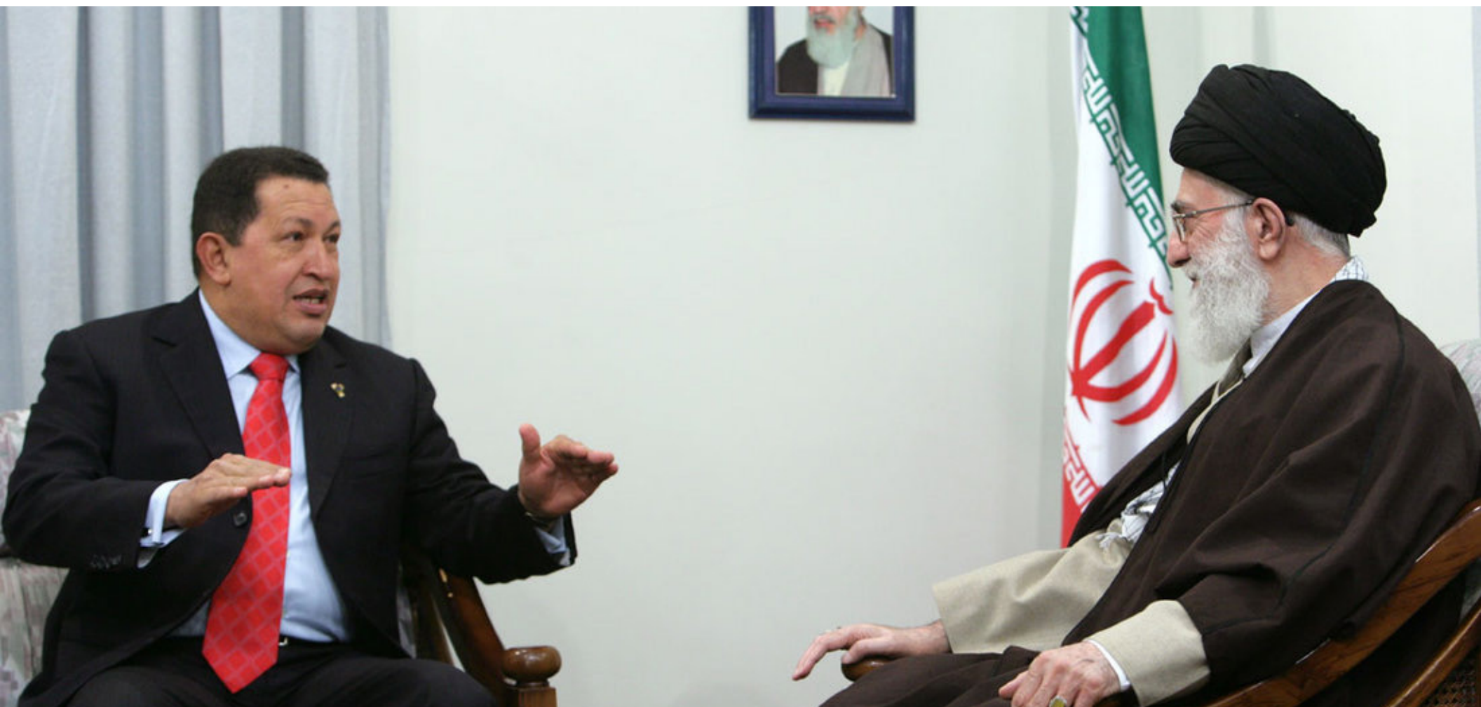
Encuentro del Presidente Hugo Chávez con el Ayatolá Jamenei