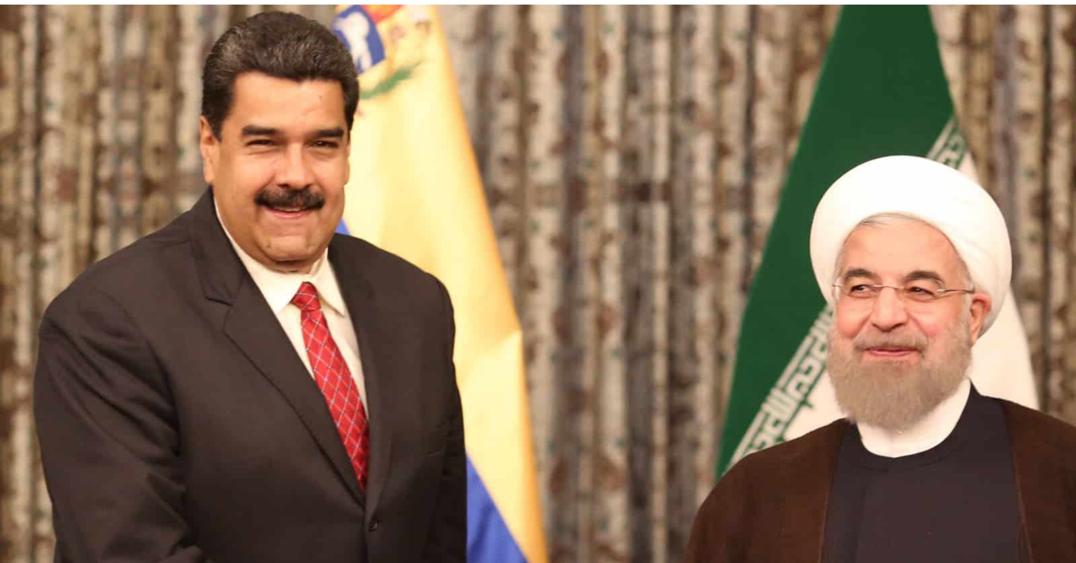
Presidente Nicolás Maduro Moros con su homólogo Hassan Rohaní