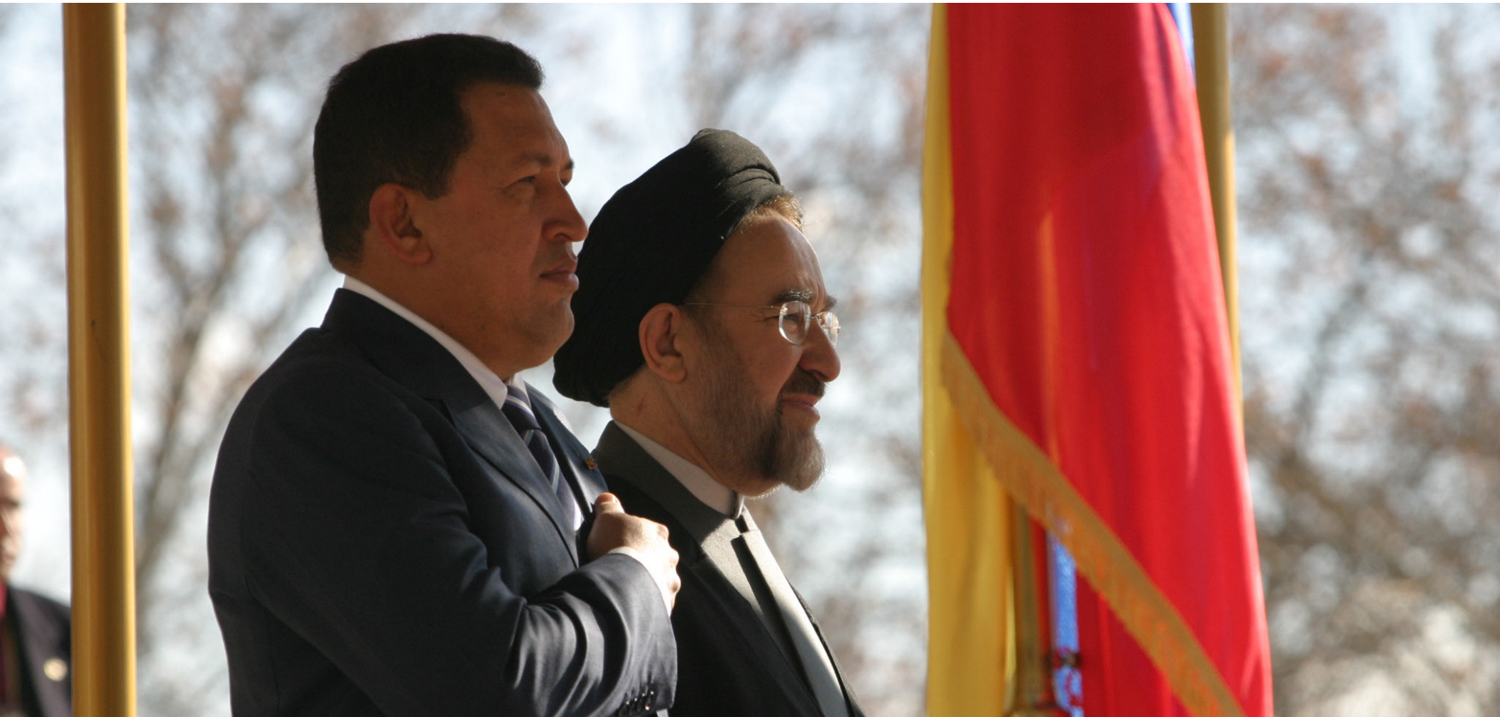
Recibimiento del Presidente Hugo Chávez por parte del presidente Mohammad Khatami