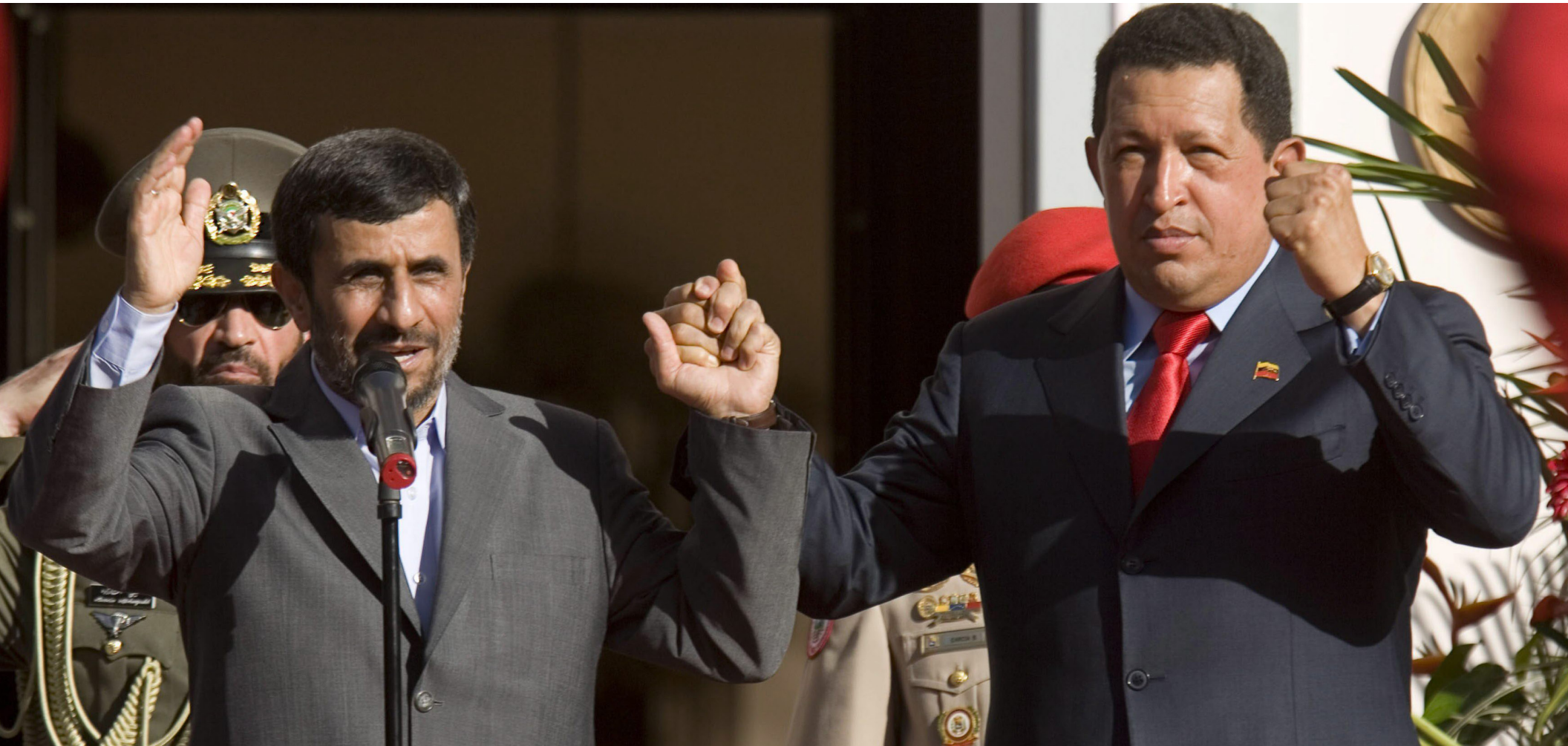
Presidente Hugo Chávez con el presidente Mahmud Ahmadinejad