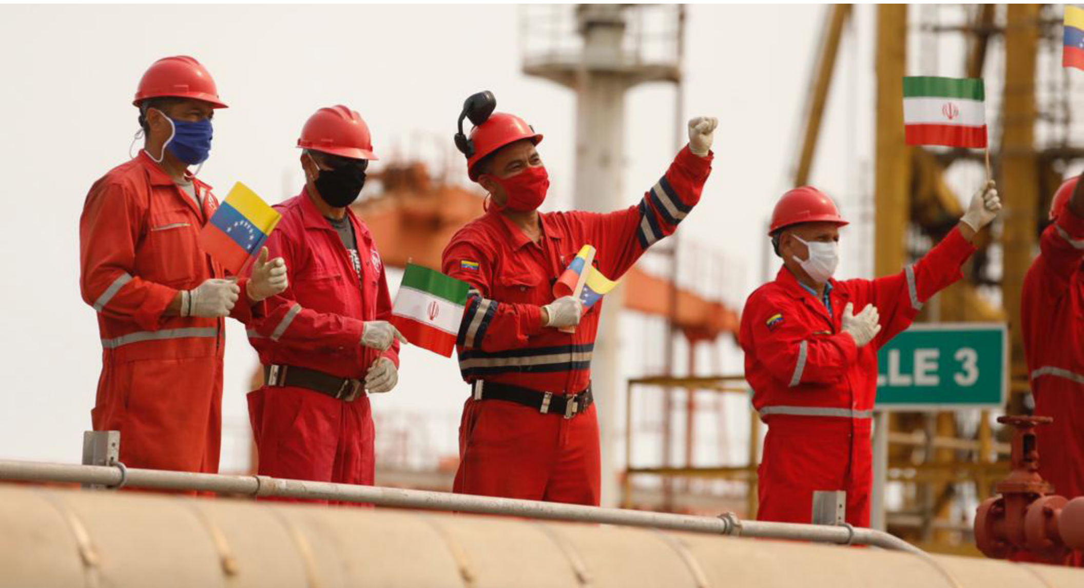
Trabajadores petroleros venezolanos celebran llegada de buques iraníes