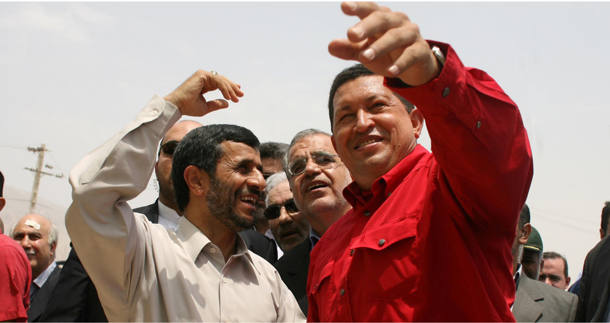
Presidente Hugo Chávez con su homólogo iraní Mahmud Ahmadinejad