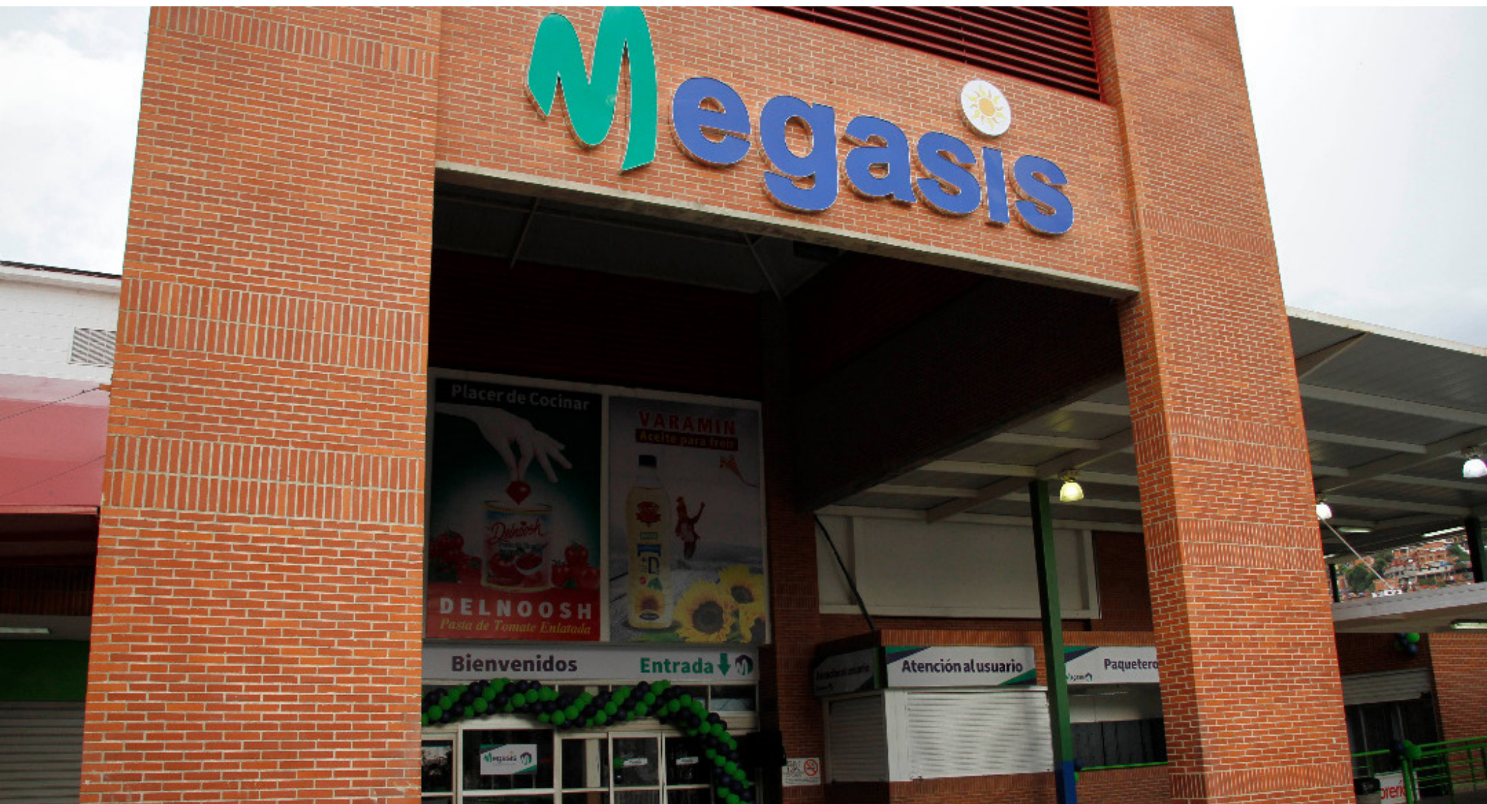
Inauguración Supermercado Megasis en Caracas