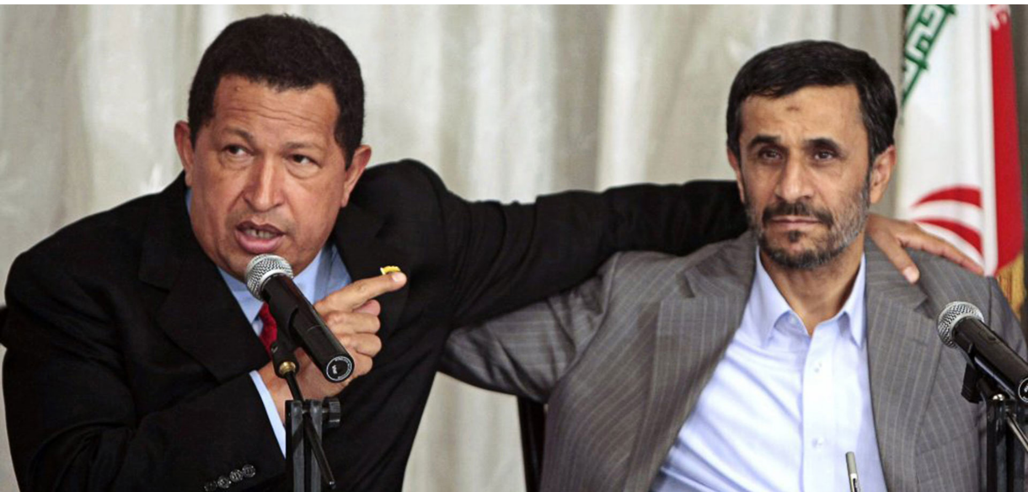
Presidente Hugo Chávez junto al presidente Mahmoud Ahmadinejad