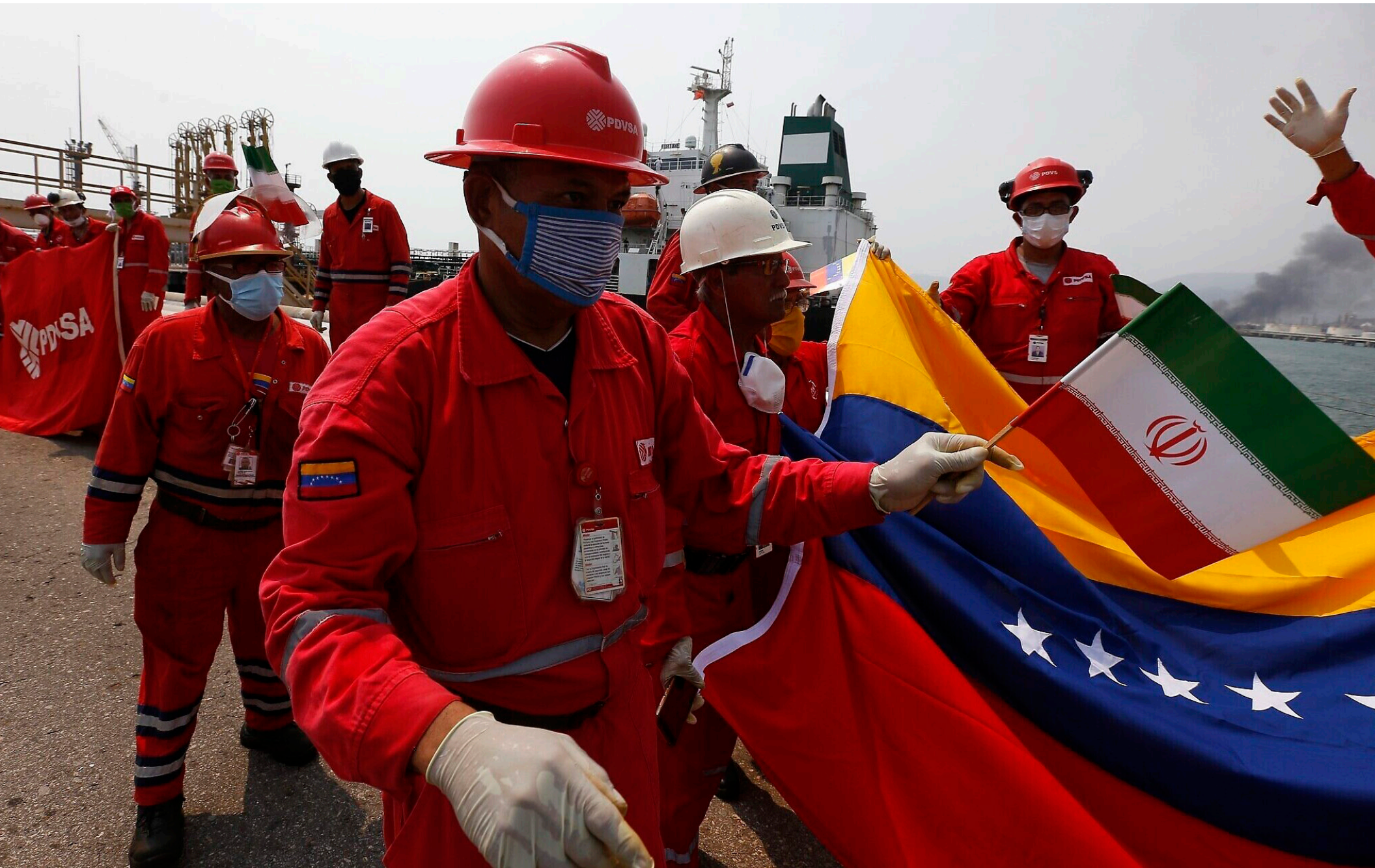
Trabajadores petroleros venezolanos celebran llegada de buques iraníes