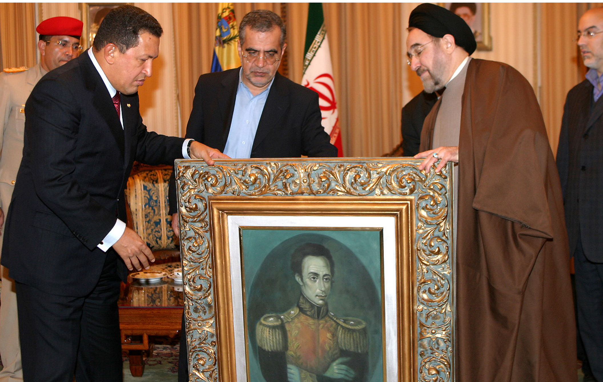
El presidente Hugo Chávez obsequia cuadro de El Libertador al presidente Mohammad Jatami