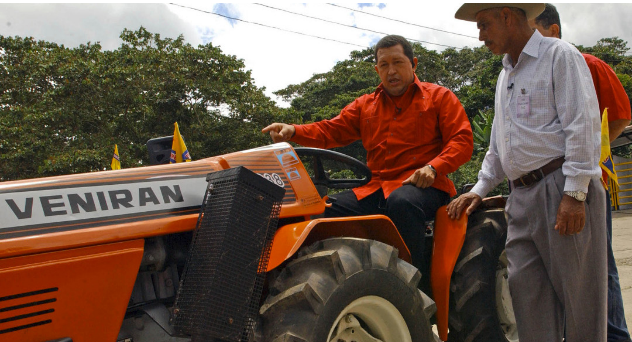
Inauguración Veneirán fábricas de Tractores