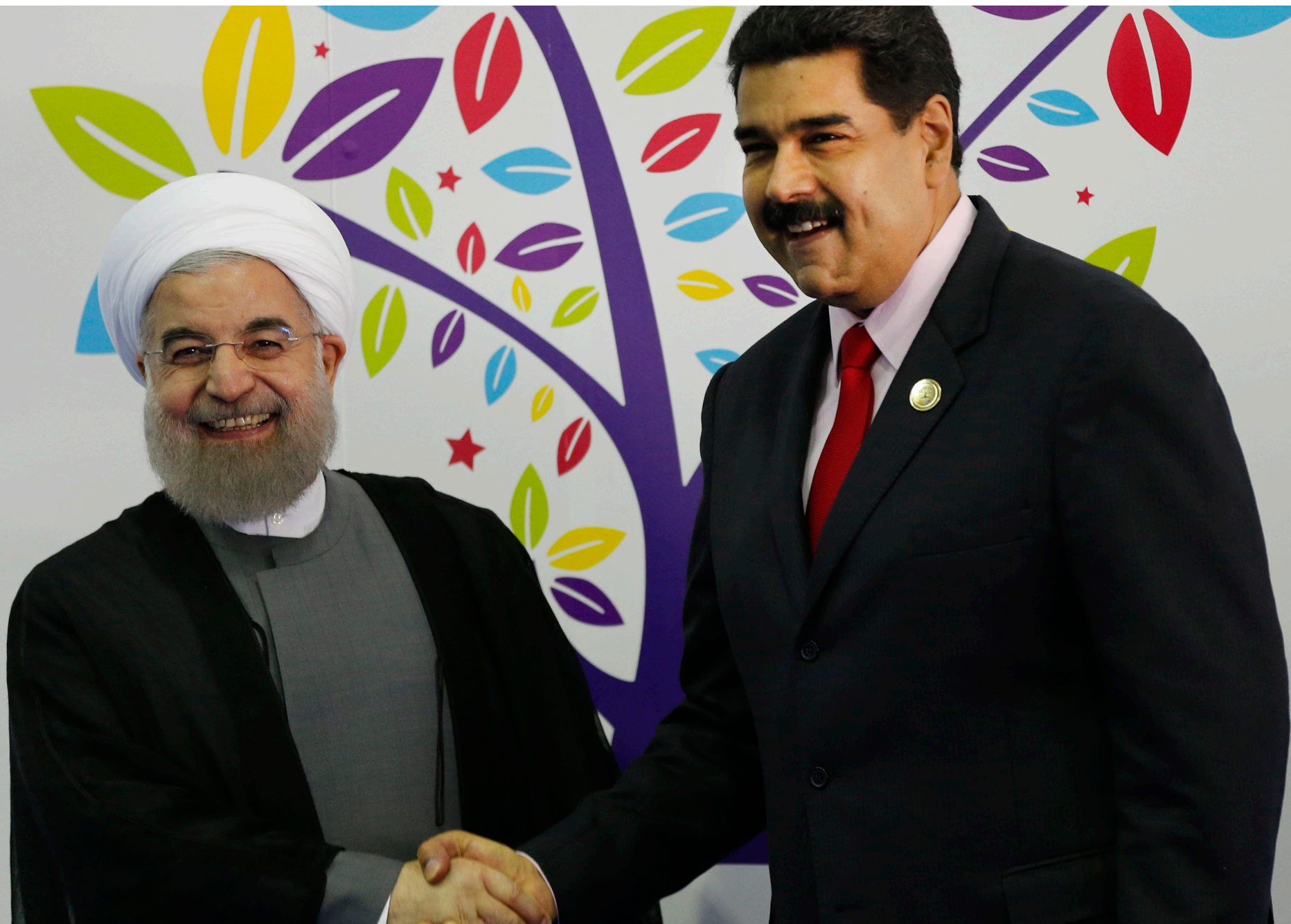
Presidente Nicolás Maduro Moros con su homólogo Hassan Rohaní